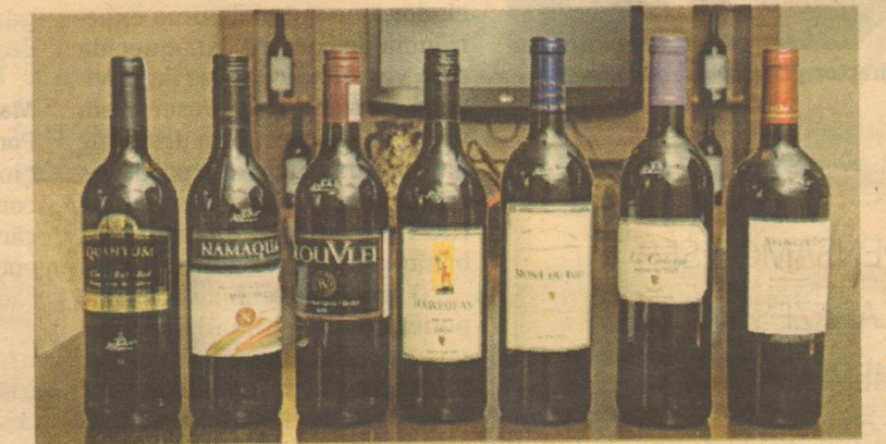
Vinhos produzidos na África do Sul têm estado a ganhar mercado em Angola

O evento contou com a presença dos produtores de vinho sul-africanos, que foram os anfitriões dos vários momentos ao longo de todo o dia e que disponibilizaram toda a informação para que a prova fosse uma experiência de sabores maravilhosa e inesquecível.